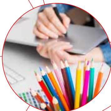
IMAGEN Y DISEÑO